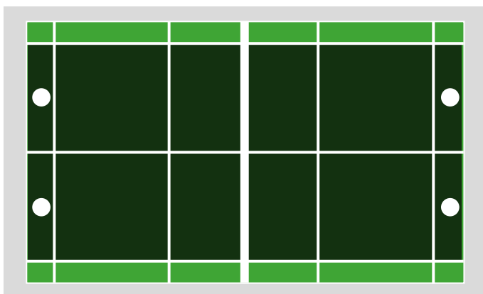
Hvis dit barn er U9-spiller eller yngre spilles der uden grøften (bagerste firkant) Figur 1

I single spilles der til den inderste linje i siden og den bagerste linje i længden. For U9 og yngre spilles der dog kun til doubleservelinjen i længden (se figur 1).