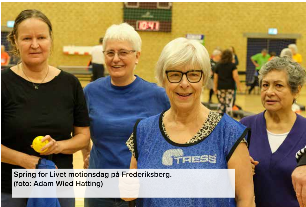
Spring for Livet motionsdag på Frederiksberg.