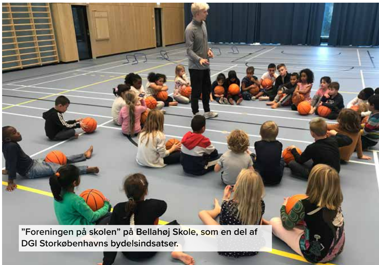
"Foreningen på skolen" på Bellahøj Skole, som en del af DGI Storkøbenhavns bydelsindsatser.