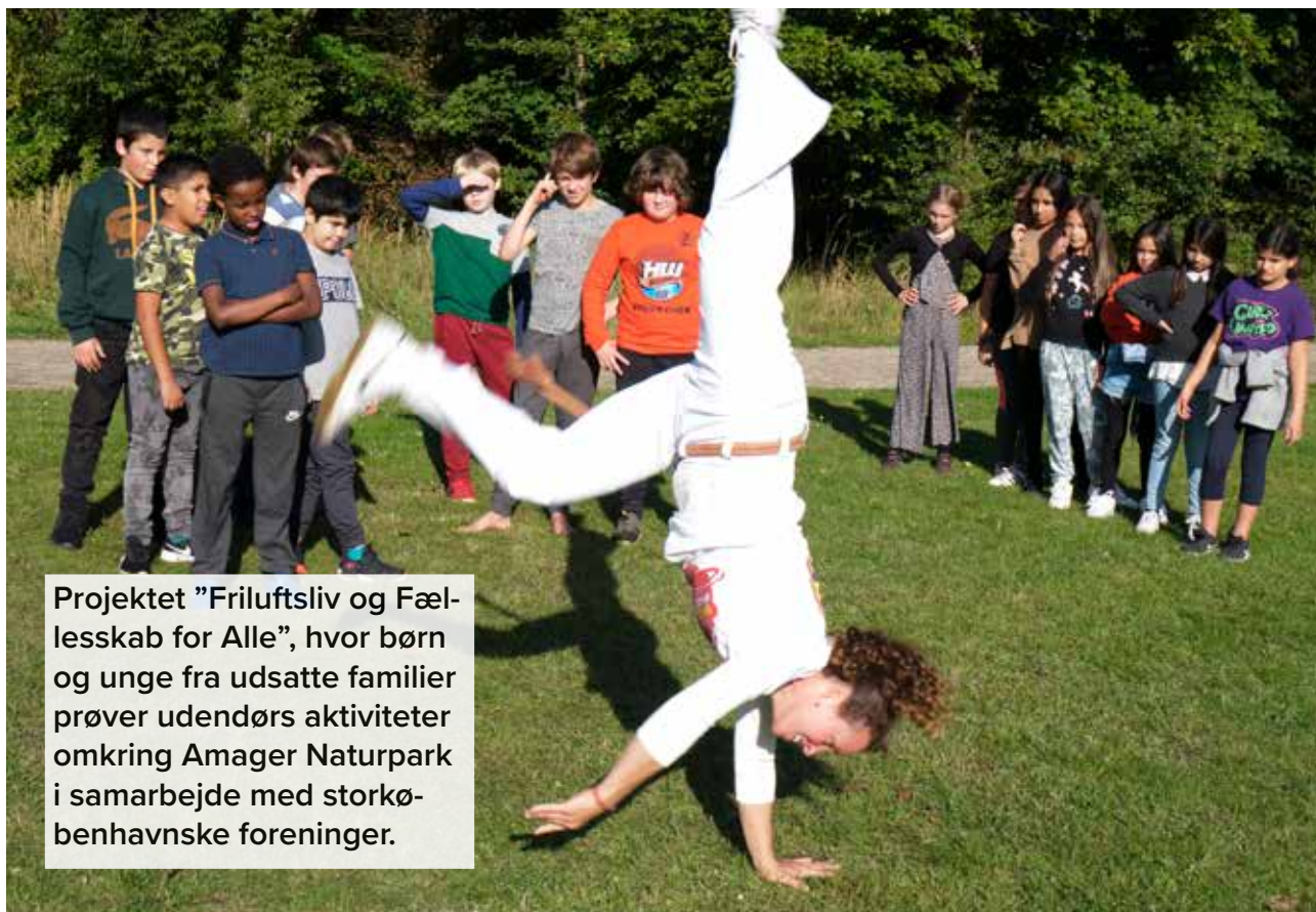
Projektet "Friluftsliv og Fællesskab for Alle", hvor børn og unge fra udsatte familier prøver udendørs aktiviteter omkring Amager Naturpark i samarbejde med storkøbenhavnske foreninger.