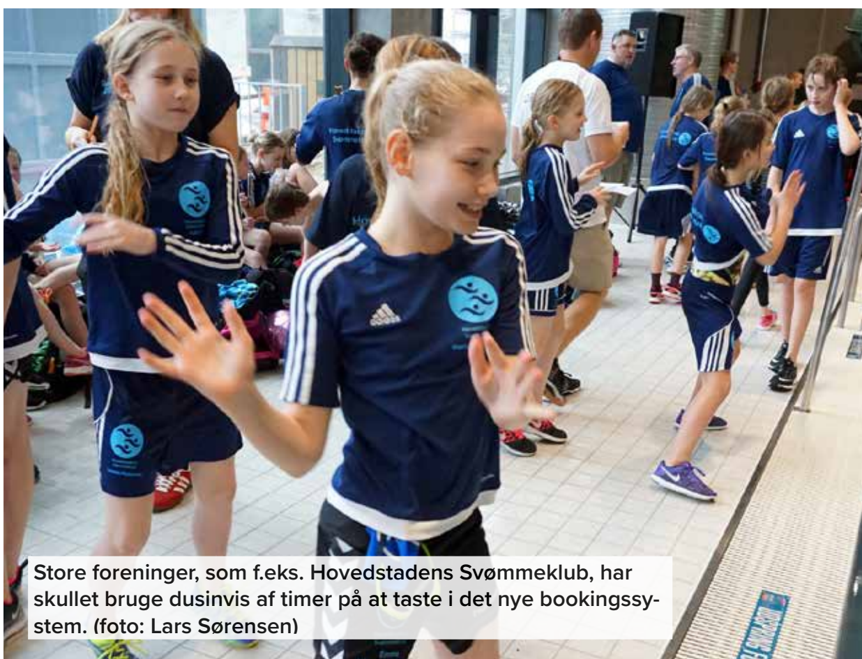
Store foreninger, som f.eks. Hovedstadens Svømmeklub, har skullet bruge dusinvis af timer på at taste i det nye bookingsystem.

Blandt andet som følge af den store utilfredshed med booking og gebyr i Københavns Kommune blandt medlemsforeningerne har vi valgt at sætte yderligere fokus på samarbejdet med idrætsgruppen i Folkeoplysningsudvalget i Københavns Kommune.