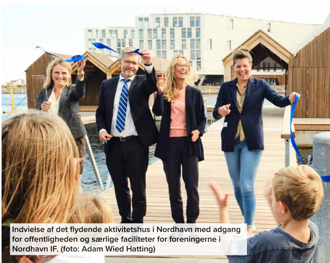
Indvielse af det flydende aktivitetshus i Nordhavn med adgang for offentligheden og særlige faciliteter for foreningerne i Nordhavn IF.

Visionsaftalerne med visionskommunerne løber frem til år 2022. Aftalerne skal bidrage til, at flere borgere lever et idrætsaktivt liv og derved medvirker det at realisere målsætningerne i DIF og DGIs fælles vision Bevæg dig for livet.