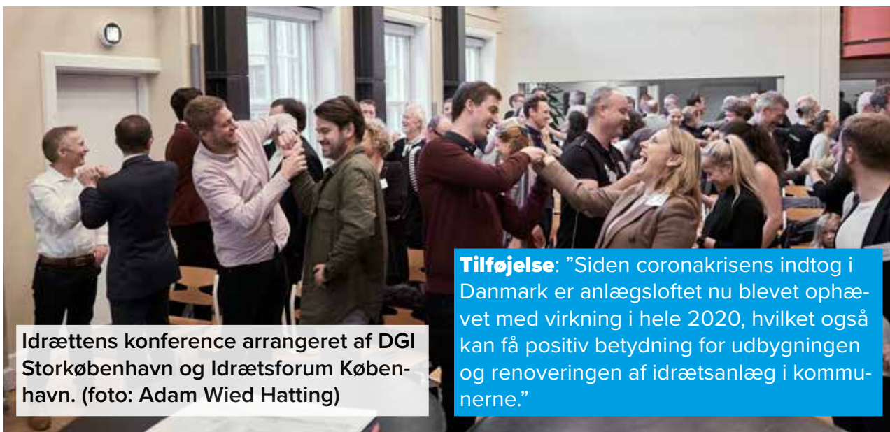
Idrættens konference arrangeret af DGI Storkøbenhavn og Idrætsforum København.

Anlægsloftet og dets betydning for foreningslivet var også på dagsordenen den 9. november 2019, hvor vi holdt en idrætskonference i København i samarbejde med Kultur- og Fritidsforvaltningen og Idrætsforum København (DIF).