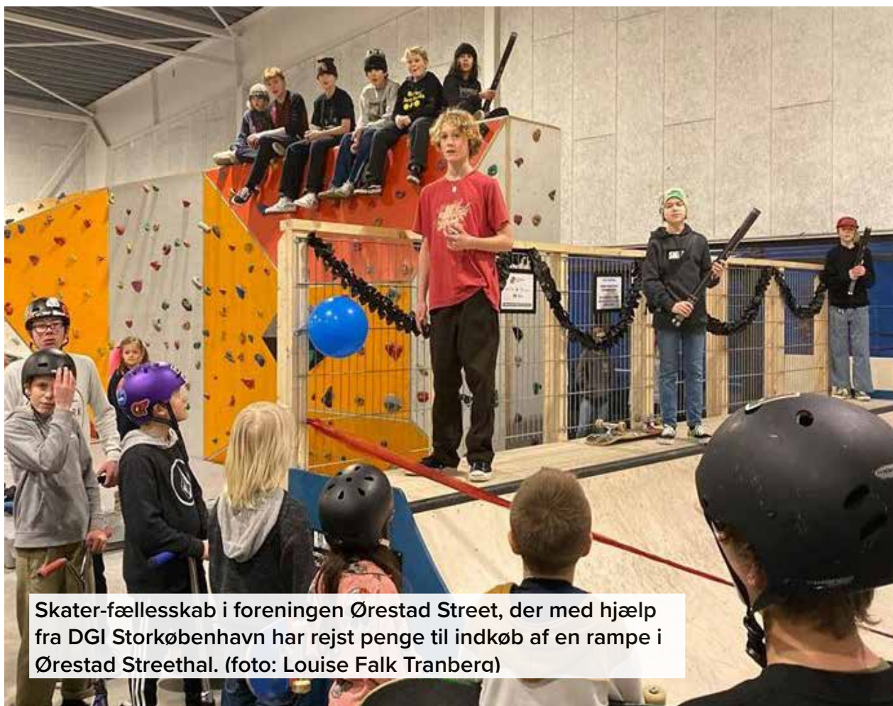
Skater-fællesskab i foreningen Ørestad Street, der med hjælp fra DGI Storkøbenhavn har rejst penge til indkøb af en rampe i Ørestad Streethal.