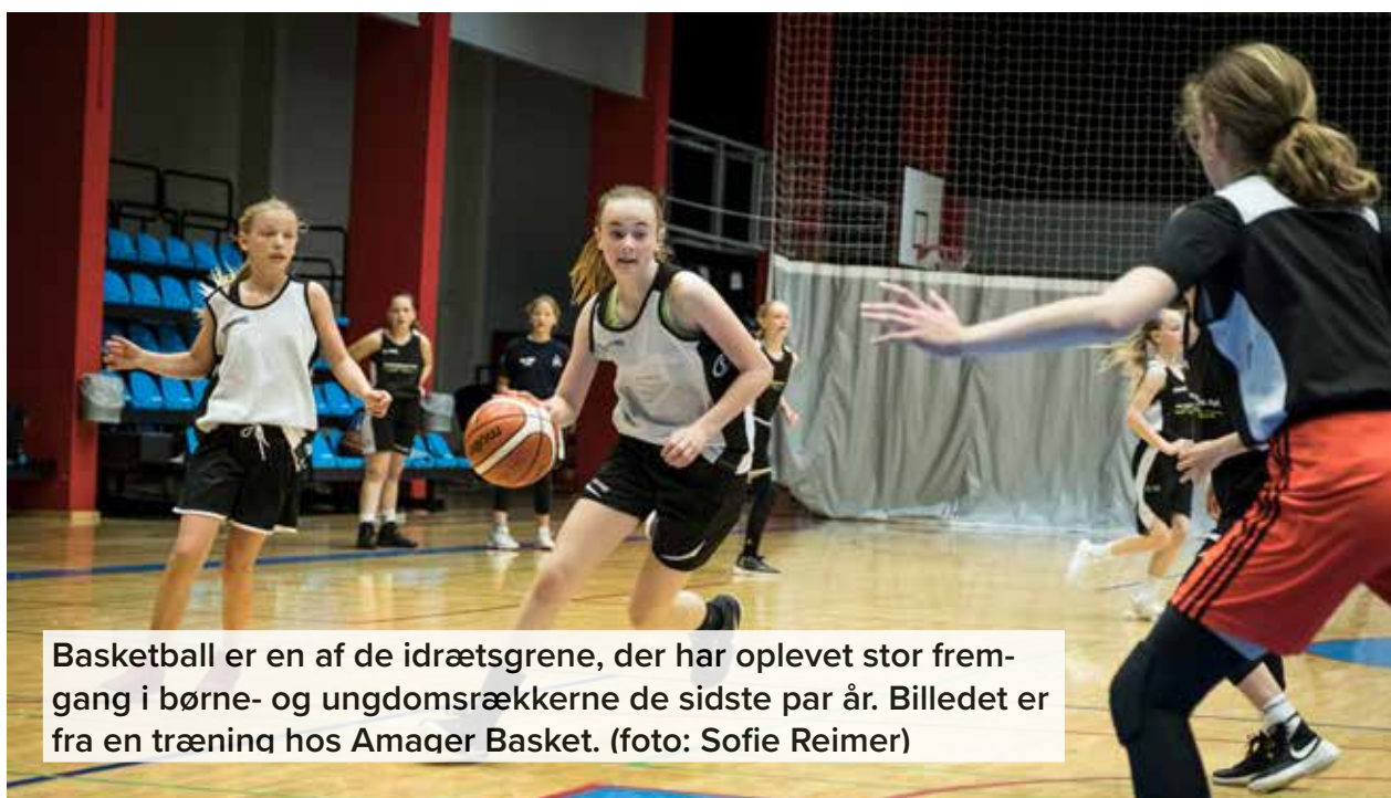
Basketball er en af de idrætsgrene, der har oplevet stor fremgang i børne- og ungdomsrækkerne de sidste par år. Billedet er fra en træning hos Amager Basket.